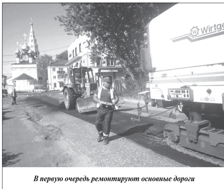
В первую очередь ремонтируют основные дороги