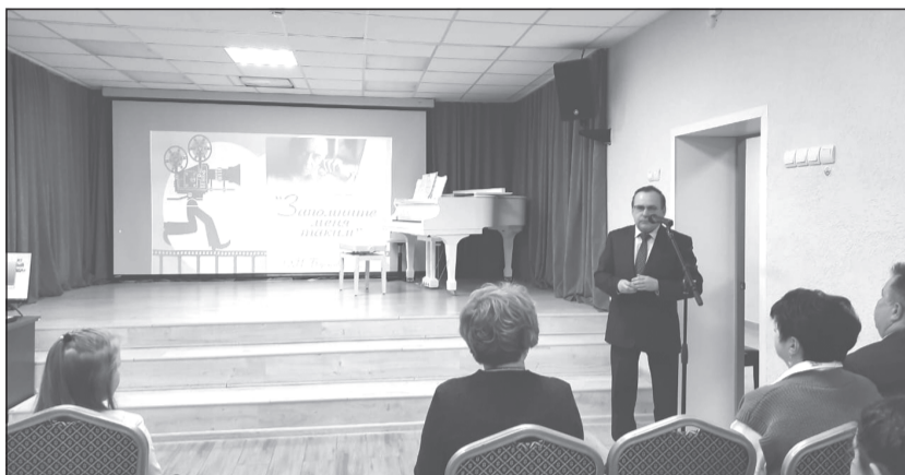
Фестиваль проходит в десятый раз, классика не стареет

На торжественном открытии недели памяти О.И.Борисова присутствовали зампредела Ивонской обл. Думы, руководитель фракции «Единая Россия»