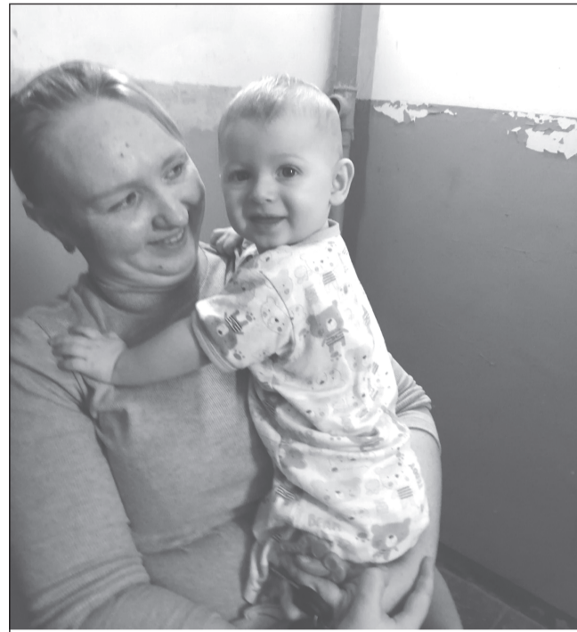
В результате грамотных действий судебных приставов малыш был возвращён матери

Ивановские судебные приставы разыскали ребенка и передали его матери. Два месяца отец скрывал своего 9-месячного сына от бывшей супруги, с которой по решению суда, должен проживать мальчик.