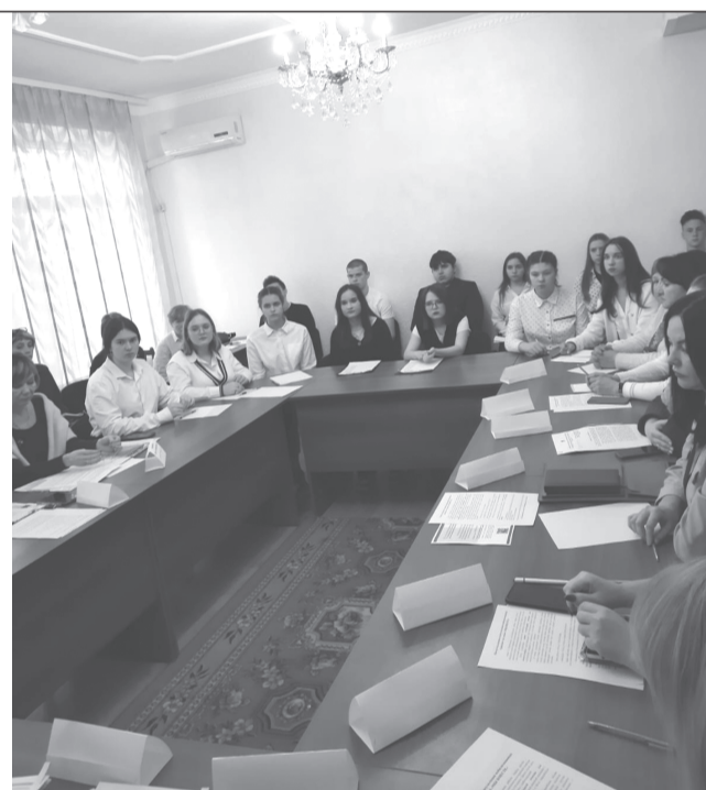
Круглый стол: вопросы и ответы

ФССП (судебные приставы), ОМВД, нотариуса и других заинтересованных лиц.