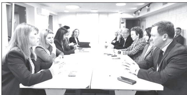
Важно показать привлекательность региона в целом.

На круглом столе Агентства стратегических инициатив обсудили реализацию проекта «Открытая промышленность» на территории Ивановского региона.