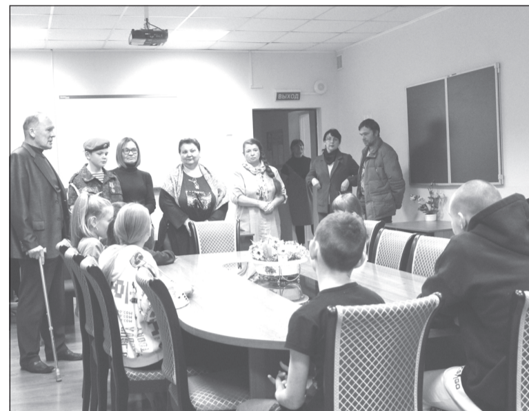
Районному отделению «Боевого братства» хватает тепла, чтобы обогреть сирот Фурмановского детдома

Сегодня многие занимаются сбором гуманитарной помощи нашим военнослужащим, проходящим службу в зоне специальной военной операции на Украине. Однако нельзя забывать и о помощи учреждениям соцзащиты, таким, как детские дома, больницы, дома престарелых и инвалидов.