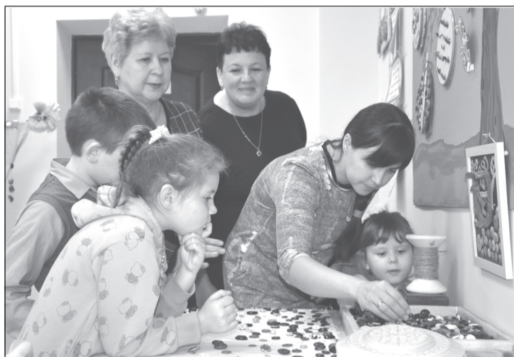
Ребята с интересом рассматривали работы, каждый пришил свою пуговичку

Во Всемирный день рукоделия и Всемирный день пуговиц в Общественном историко-краеведческом музее г. Приволжска состоялось подведение итогов конкурса-фестиваля «Пуговичный style», который проводился второй раз.