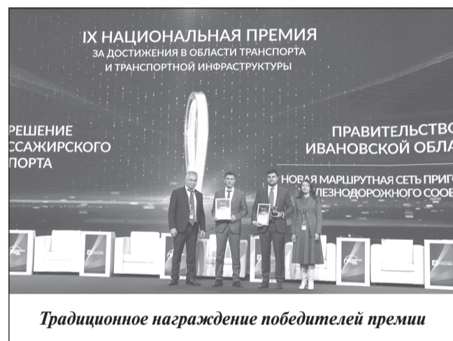
Традиционное награждение победителей премии

го по новой сети ежедневно курсируют 44 поезда, часть из которых синхронизирована с «Ласточкой» Москва-Иваново. Пассажирские перевозки «Орланами» за период действия сети выросли в два раза. Проект реализован без дополнительных инвестиций за счет текущей деятельности РЖД, СППК и Правительства Ивановской области.