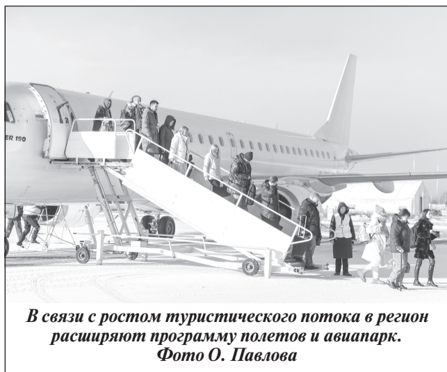
В связи с ростом туристического потока в регион расширяют программу полетов и авиапарк.