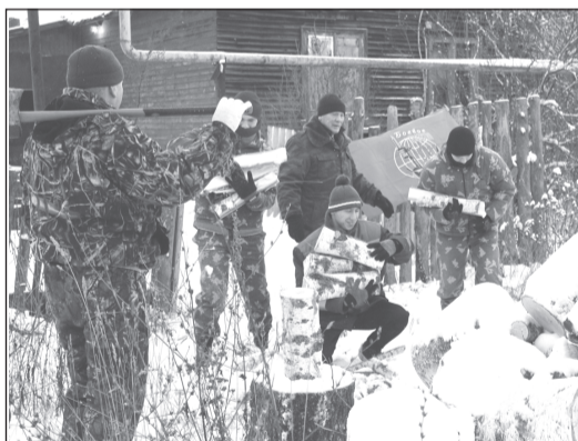
Пусть ребята служат спокойно, земляки поддержат их родителей и словом, и делом