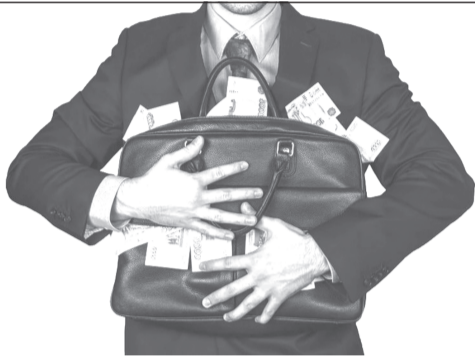
Обман вместо помощи

УФСБ России по Ивановской области совместно с УМВД России по Ивановской области выявлен факт мошенничества со стороны бывшего представителя адвокатского сообщества.