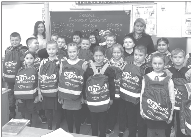
Викторина показала, что дети хорошо знают правила дорожного движения

Ребята, разделившись на две команды, по очереди проходили блиц-опрос, участвовали в конкурсе «Разгадай кроссворд», игре «Дорожные знаки», в рамках творческого задания оформили плакат, призывающий соблюдать правила дорожного движения. Победила дружба.