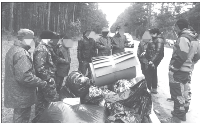
Момент передачи вещей, собранных неравнодушными гражданами

В рамках работы штаба общероссийской акции взаимопомощи «МЫ ВМЕСТЕ» в Приволжском районе организован сбор гуманитарной помощи для военнослужащих, которые сейчас находятся в учебных центрах либо отправляются в зону спецоперации.